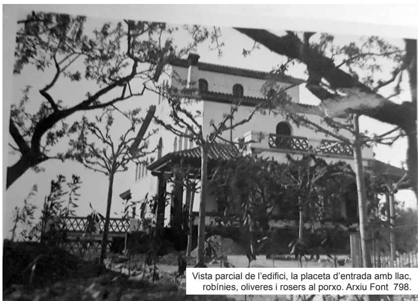
Vista parcial de l'edifici, la placeta d'entrada amb llac, robínies, oliveres i rosers al porxo.

D'altra banda, i pel que fa al casal, amb les vistes a quatre vents de l'edifici, projectades i meditades no fruit de la casualitat, respon a l'estètica noucentista: el terrat nord amb vistes a Montserrat; el terrat de damunt del pòrtic d'entrada amb vistes al massís de l'Ordal; el mirador, sobre del garatge, amb vistes a la població i al castell de Gelida, i finalment la terrassa d'entrada, al sud-oest, amb vistes a la plana penedesenca.