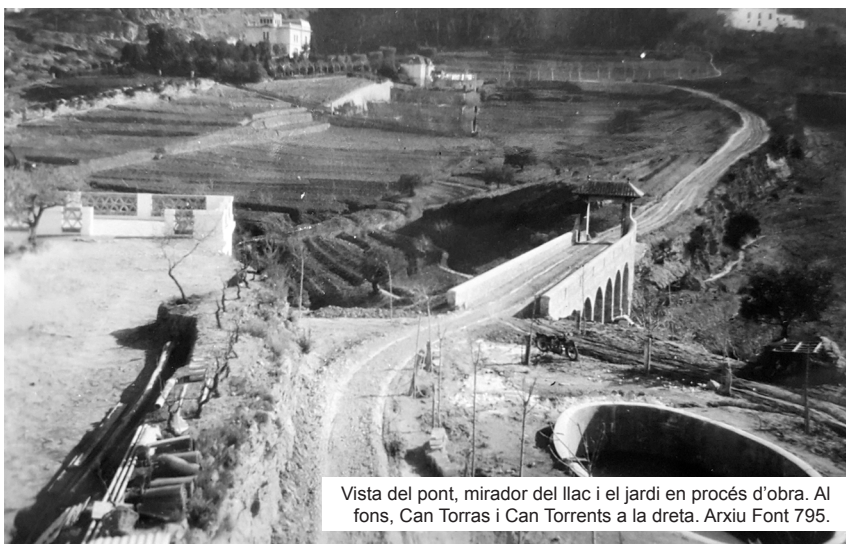
Vista del pont, mirador del llac i el jardí en procés d'obra. Al fons, Can Torras i Can Torrents a la dreta.

Es tracta d'una obra de dimensions considerables. Per accedir a l'indret on es volia ubicar l'edifici, l'accés era difícil i calia salvar el torrent de La Coma, fet que va comportar el disseny i la construcció d'un pont de 38 metres de llarg i 4,50 metres d'amplada, que es projectà amb sis pilars, set arcs i un pòrtic d'entrada que fou dissenyat per l'aleshores arquitecte municipal, José Ros i Ros.