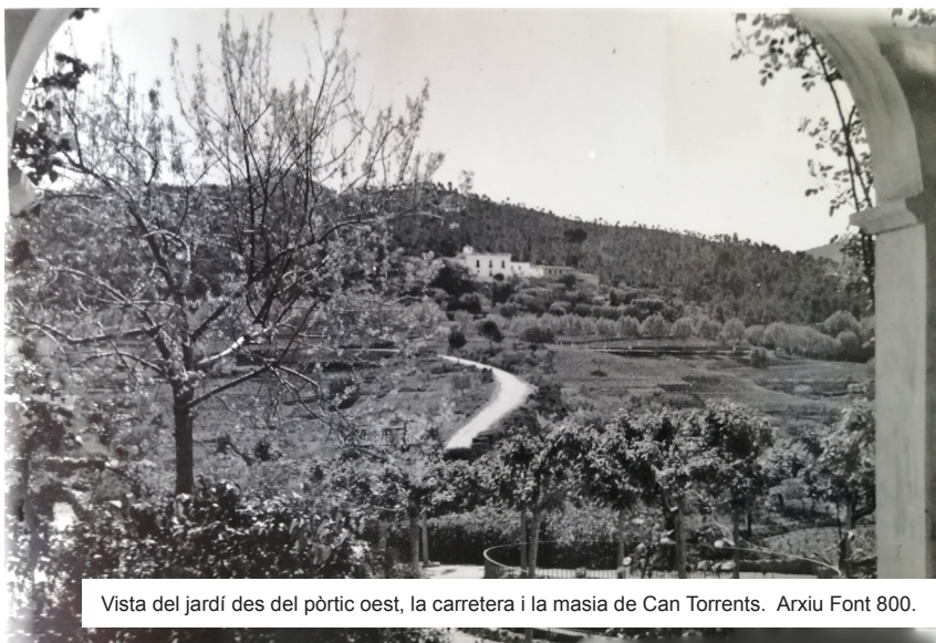
Vista del jardí des del pòrtic oest, la carretera i la masia de Can Torrents.

i llenguatges estètics, com ara l'arquitectura, l'escultura, la pintura, etc., han viscut diferents moments històrics i estilístics, i els que han pogut sobreviure i s'han conservat al llarg dels temps conserven, poc o molt, l'evolució dels gustos del moment.