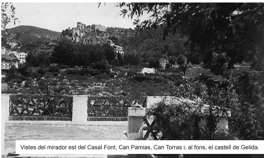
Vistes del mirador est del Casal Font, Can Pamias, Can Torras i, al fons, el castell de Gelida.

Per contra, es trencà amb les tradicions de jardineria romàntica cultivades fins aleshores arreu i també a Gelida, on la visual de la muntanya de Montserrat esdevenia un element simbòlic preferent, hereu de l'imaginari d'arquetip de paisatge de la Catalunya de la Renaixença. La muntanya sagrada i mítica, amb jardins de forts elements arboris més propis dels paisatges humits de muntanya assilvestrats, salvatges i naturals, molt presents a l'antic jardí de la casa Monturiol i el jardí de La Gelidense. Així com també en les primeres cases d'estiueig de Gelida, ubicades estratègicament al carrer Sant Lluís, al vessant nord del poble, com la casa Jové i Can Llobet (1886), Can Valls (1917) i el jardí de la Torre Monturiol (1888), que es van bastir per poder tenir vistes privilegiades a la muntanya de Montserrat.