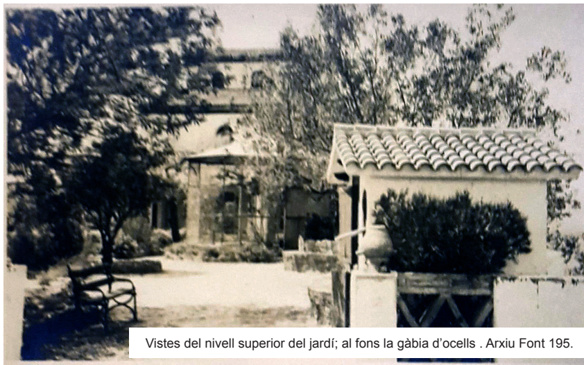
Vistes del nivell superior del jardí; al fons la gàbia d'ocells .

Es tracta d'un jardí amb una doble funcionalitat: la del jardí com a espai estètic i la del jardí productiu. És una simbiosi perfecta entre un projecte de jardí productiu llatinitzant, dissenyat amb més seny que no pas vocació o esperit artístic. El fet que imperi la voluntat productiva fa que no el puguem classificar com un jardí noucentista basat en els cànons academicistes propis del corrent cultural.