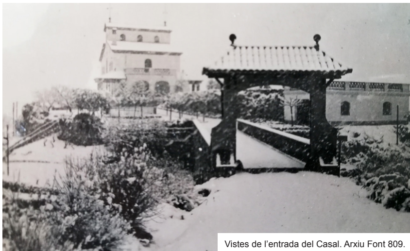
Vistes de l'entrada del Casal.

Alexandre Font havia escollit Gelida com a lloc d'estiu. Després