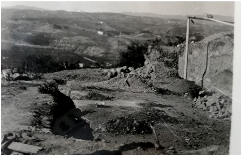
Vistes del terreny de La Coma en fase de fonamentació, 1927.