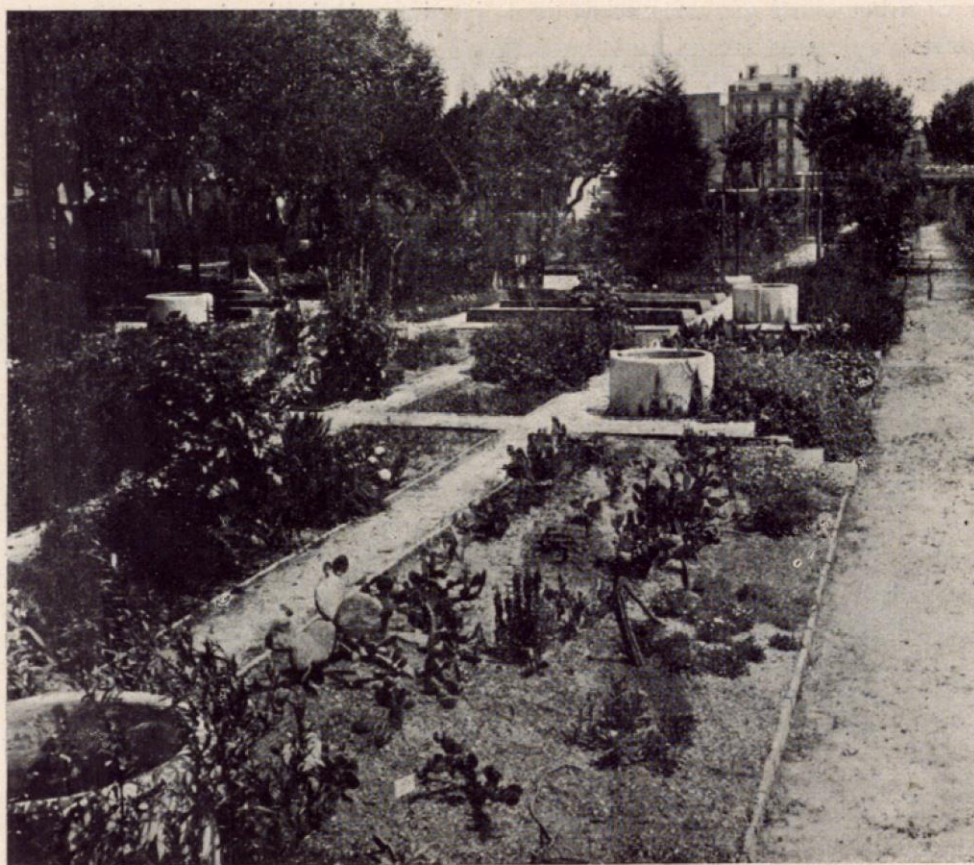
Platabandes d'assaig al jardí de l'«Escola dels Bells Oficis».

Es la Ciutat-Jardí, dels infants de pell colrada plens de sanitat; de la noia del llibre sota el bràs; del jove ben fet d'esport; front ample d'estudi que aquilota una pipa; del festeig digne en que la veu no rebota a les parets si no que es perd al lluny; de l'interior, que a la vetlla, en surt una musica que fa aturar.