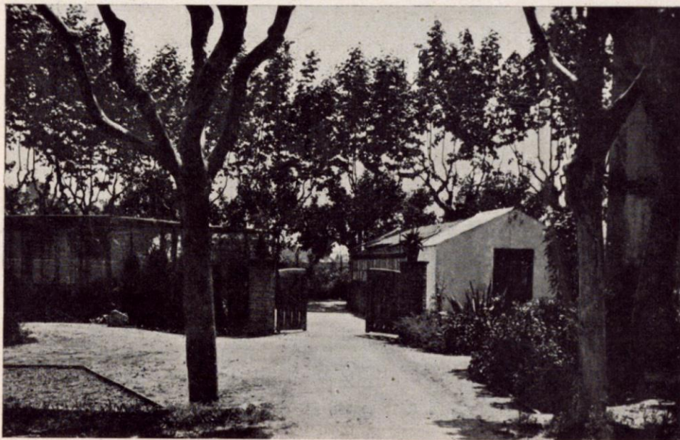
Vista de l'entrada i de l'invernacle del jardí experimental de l'«Escola dels Bells Oficis».